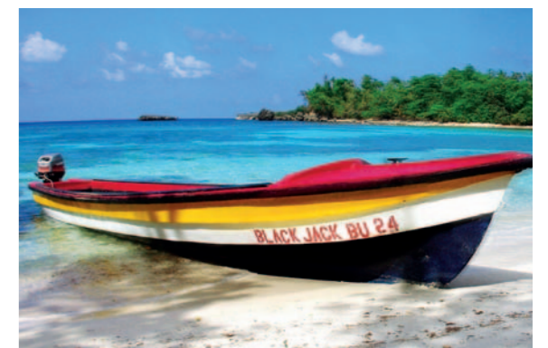
25 ◀ KulturKino: Reisefilm in Biberach