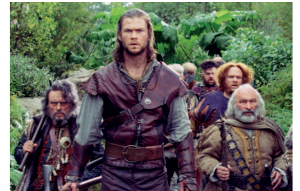
10 ◀ Snow White and the Huntsman

Seite 26 Traumpalast Schorndorf Seite 27 Traumpalast Waiblingen Seite 28 Traumpalast Esslingen Seite 29 Traumpalast Nürtingen Seite 30 Traumpalast Biberach