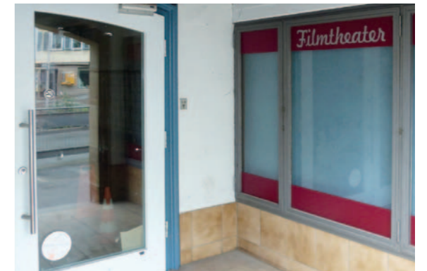
Traumpalast Backnang: Ab Herbst 2012! ▶ 16