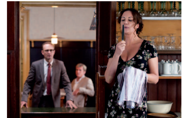
10 Die Kirche bleibt im Dorf

Seite 26 Traumpalast Schorndorf Seite 27 Traumpalast Waiblingen Seite 28 Traumpalast Esslingen Seite 29 Traumpalast Nürtingen Seite 30 Traumpalast Biberach