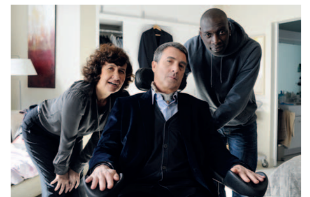
24 KulturKino: Sommerfilmfestival